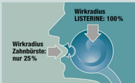
Klinisch bewiesen: LISTERINE ist langfristig verwendet gut verträglich und hält Mundflora, Zähne und Zahnfleisch gesund.

Mundgesundheit ist nicht nur wichtig für die Zähne, sondern auch für den ganzen Organismus.