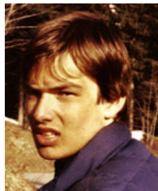
Geschädigter Vogt Diagnose Fettsucht