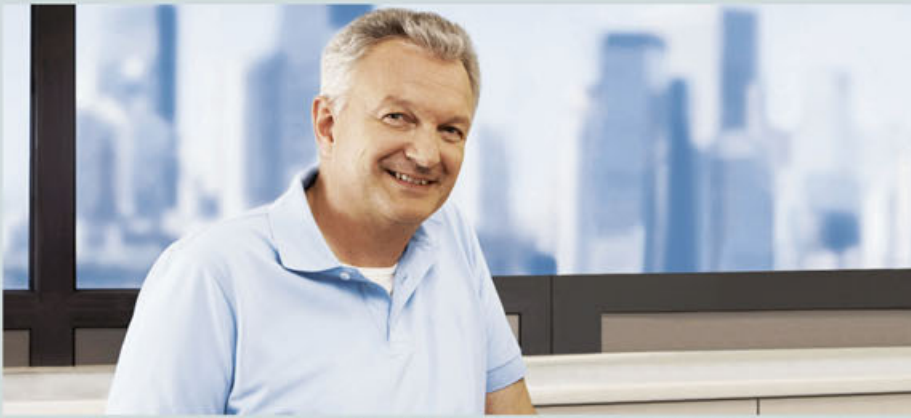
Die Kombination aus Zahnputzen und der antibakteriellen Mundspülung LISTERINE schützt vor schädlichen Bakterien und erhält die Gesundheit Ihrer Zähne.